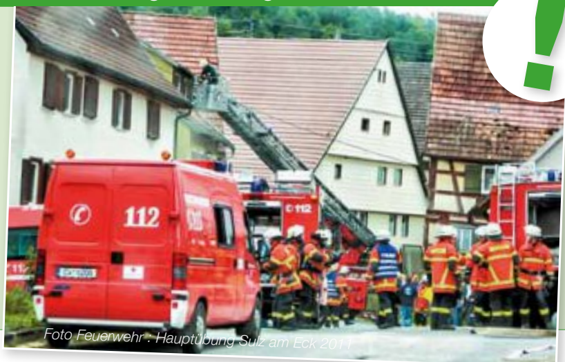
Foto Feuerwehr - Hauptübung Sulz am Eck 2011

Die Bevölkerung ist herzlich zum Zuschauen eingeladen!