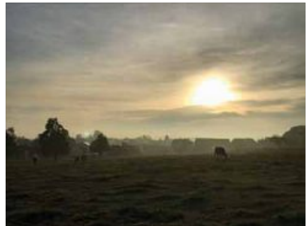
Morgen in Schönbronn