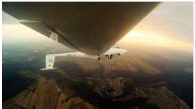
Wildberg steht Kopf

Coupon ausfüllen, ausschneiden und bis zum 15. Januar 2017 im Wildberger Rathaus abgeben