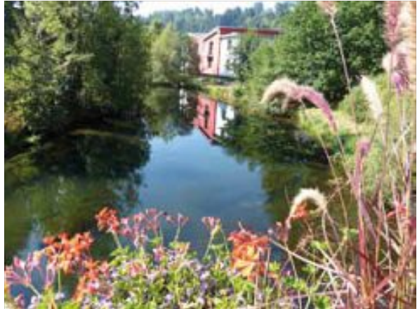
Spiegel der Zeit