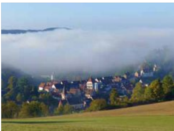
Nebel über dem Nagoldtal