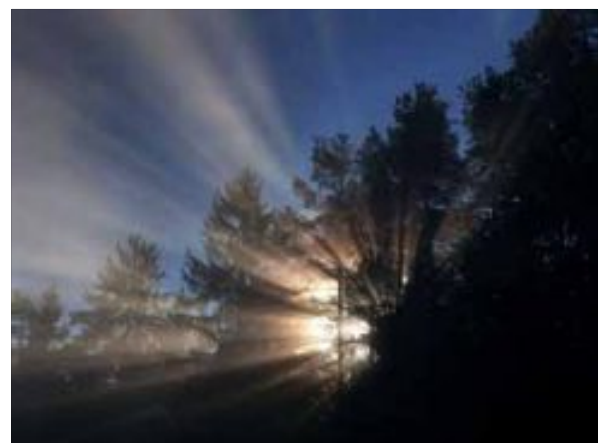
Sonnenaufgang auf dem Wächtersberg