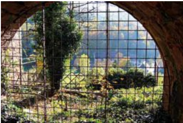
Von der Oberstadtbrücke zum Kloster