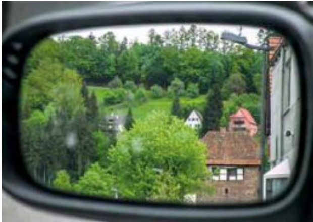
Blick zurück in die Talstraße