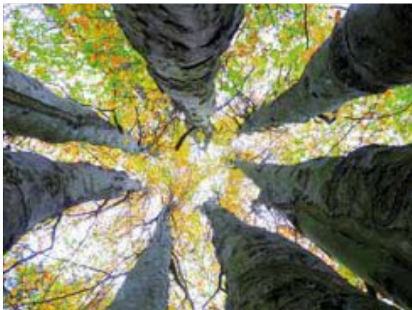
7 Buchen wachsen hin zum Himmel