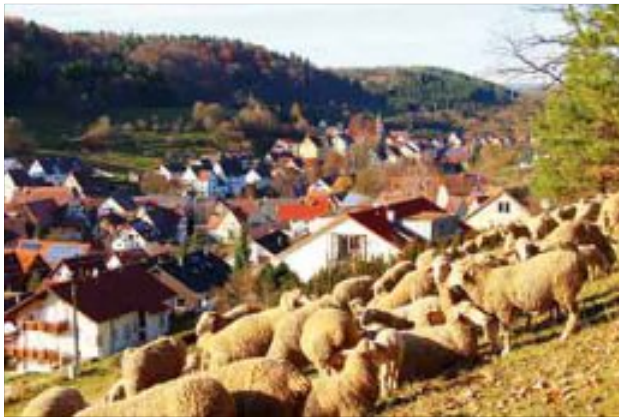
Kurze Rast im Sulzer Tal

Mitwählen kann man auch per E-Mail an tourismus@wildberg.de : Einfach Ihren Namen, die Adresse und das Lieblingsbild angeben. Im Betreff sollte „Wildberger Fotowettbewerb“ stehen.