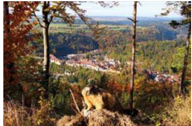
Seltene Gäste im Spätsommer