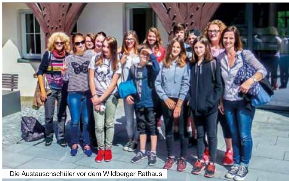
Die Austauschschüler vor dem Wildberger Rathaus