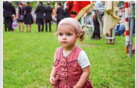
Klein aber fein

Mein persönlicher Vorschlag (bitte ankreuzen)