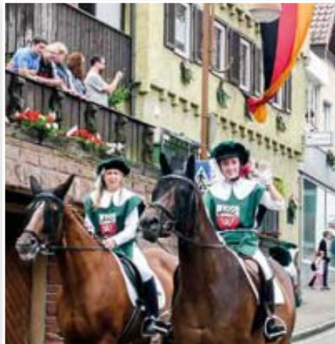
Hoch zu Ross durch Wildberg