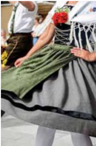
Zum Tanze da geht ein Mädlel