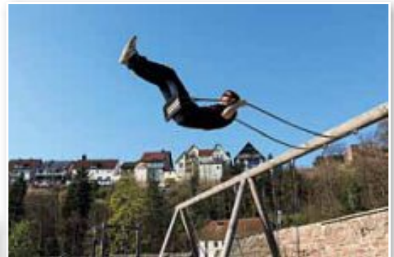
Schwungvoll vom Kloster in die Oberstadt