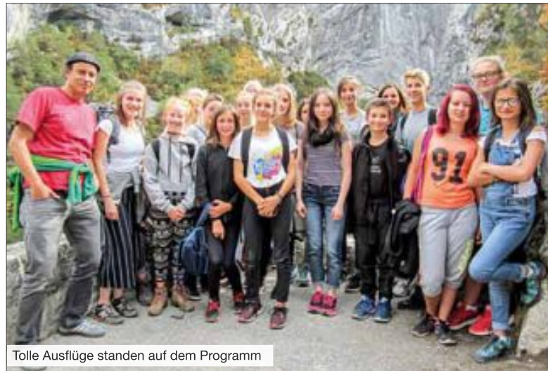
Tolle Ausflüge standen auf dem Programm

dem Programm. Bereits am Tag nach der Ankunft wurden sie im Rathaus Digne les Bains empfangen. Die Tage darauf besuchten die Gastschüler regionale Museen, Ateliers, urige Manufakturen und Orte in der näheren Umgebung. Eindrücklich in Erinnerung blieb die Besichtigung der Porzellanmanufaktur „Atelier de Faïence Lallier“; dort werden in kunstvoller Handarbeit Geschirr und Skulpturen hergestellt. Neben der regelmäßigen Teilnahme am Unterricht genossen die deutschen Schüler aber auch die einmalige Naturwelt in der Umgebung von Digne les Bains. Die Stadt liegt malerisch im Gebiet der Haute-Provence. Bei schönem Wetter ging es unter anderem auf Trebooten über den Lac de Ste Croix oder zu Fuß durch einen Teil der Verdonschlucht.