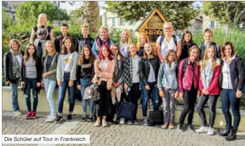
Die Schüler auf Tour in Frankreich

Für die Schüler des Bildungszentrums bleibt die Reise sicher auf lange Zeit unvergessen. Abwechslungsreiche und spannende Ausflüge standen auf