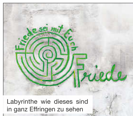
Labyrinth wie dieses sind in ganz Efringen zu sehen