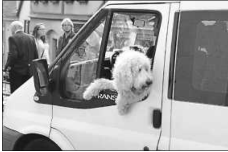
Wer sitzt wo?

Liebe Mitglieder und Freunde des Stadtseniorenrats, wie merken wir eigentlich, dass wir alt werden? Stand da neulich zu lesen: Anfangs liegt man im Maxi Cosi rum, dann hängt man im Auto hinten im Kindersitz. Mit 12 darf man endlich vorne sitzen, mit 18 sogar auf der linken Seite. Dann hinten bei den Kindern, später bei den Enkeln. Wenn man gemütlich vorne rechts sitzen darf, weil man leichter einsteigen kann und mehr sieht, hat man es geschafft, man ist Senior. Eine nette Erklärung.