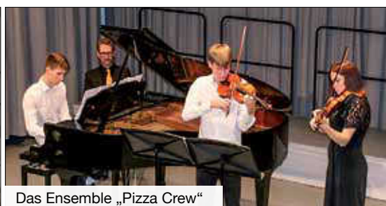
Das Ensemble „Pizza Crew“